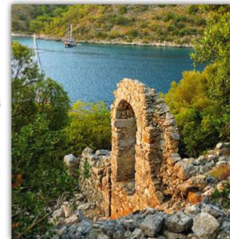
Развалины православной церкви на острове Гемилер