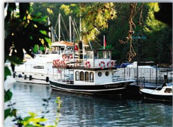
Чартерный катер доведет вас от марины Skorea Marina в Гечек к причалу яхт-клуба Club Marina

Маленькая, глубоко врезающаяся в берег бухточка на северо-западной стороне одноименного острова. Стоянка – на якоре посередине бухты. Страховые концы заводятся на столбики, установленные на западном берегу. Есть ресторан с причалом, который планируется в 2012 г. отремонтировать и удлинить. Фирменное блюдо ресторана – жаркое из ягненка и баранины. Переполненная летом бухта весной радует тишиной, безлюдностью и субтропической природой.